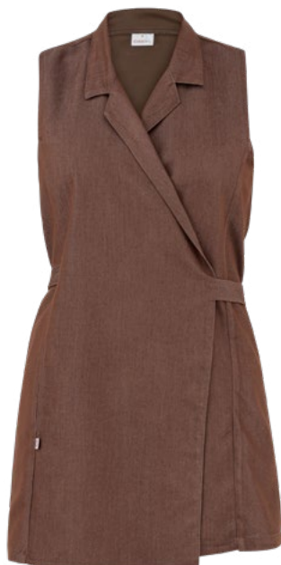
J322 Jeans marrone